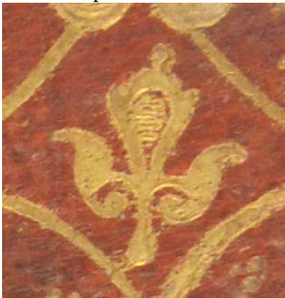
16.f.IV.1, particolare. Il fregio ricorda l'ignoto legatore romano di Ieronimo o Ruiz Binder (CHRISTIES 2015, n. 132, Statuti della religione de cavalieri Gierosolimitani, ... , Florence, Giunti, 1567.