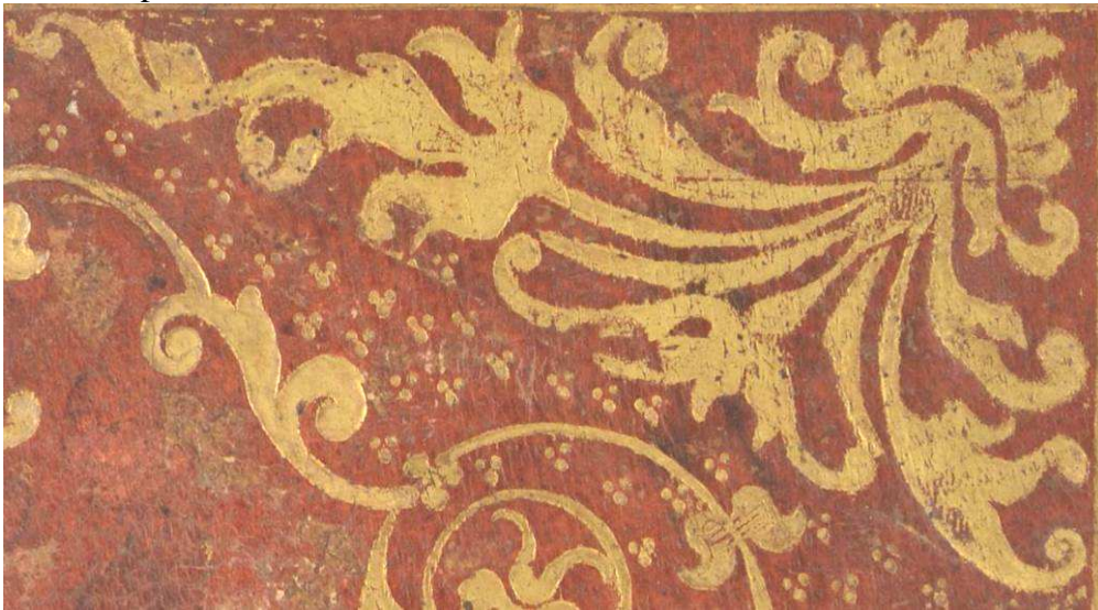
16.f.IV.1, particolare. Cfr. 16.f.IV.42.