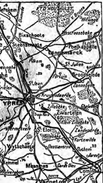
Villaggi occupati dai francesi

La linea di Hindenburg, di cui tanto si è parlato nella primavera scorsa, non è mai esistita come linea continua di trincee, bensì come una successione di punti fortificati disposti in profondità e diversi l'uno dall'altro a seconda della natura del terreno e della sua posizione rispetto all'offesa avversaria.