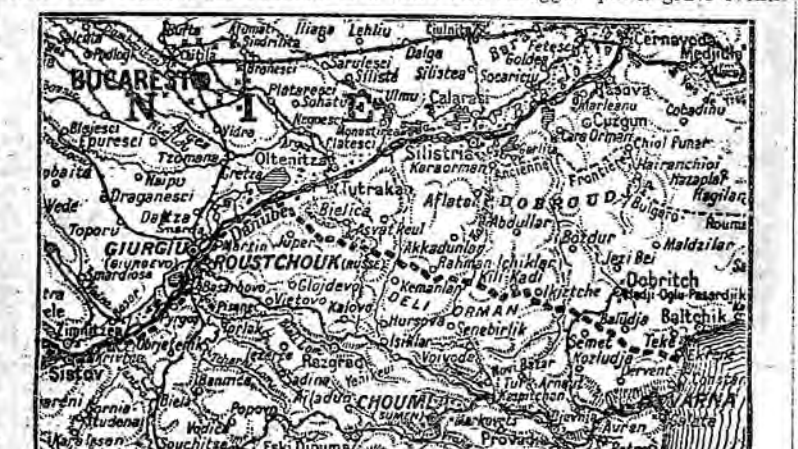
Map showing the Danubian region with locations like Giurgiu, Ruscuc, and various military units.

Il corrispondente di un giornale da una città sulla costa orientale dell'Inghilterra così descrive la distruzione del secondo Zeppelin.