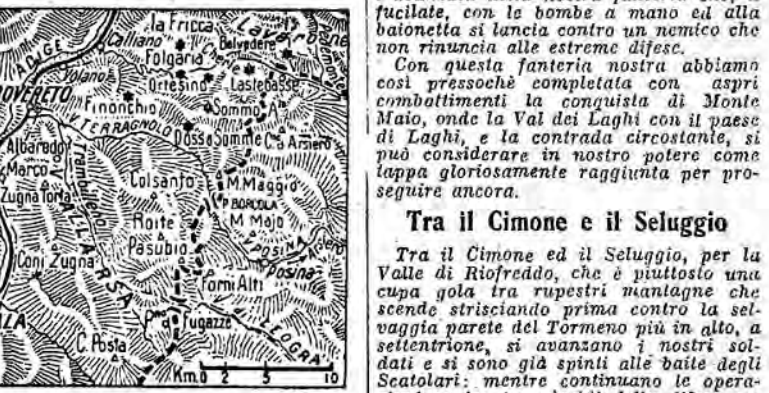
Dal Col di Posina alle vette di Monte Maio

A. Col di Posina i nostri battaglioni di fanteria, dopo i tristi giorni della ritirata, stettero fermi ad aspettare l'ora della riscossa. Già la difesa del Colle era costata a quei battaglioni non poco spargimento di sangue, avendo essi, dai primi agli ultimi giorni del giugno, dovuto respingere continui attacchi nemici e sostenere il fuoco delle artiglierie.