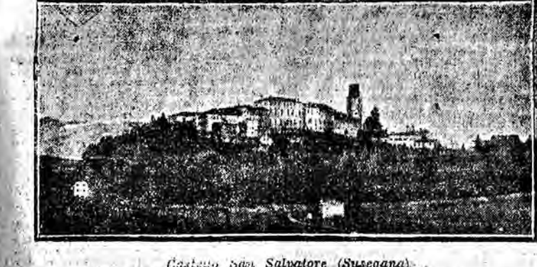
Castello San Salvatore (Susegana).