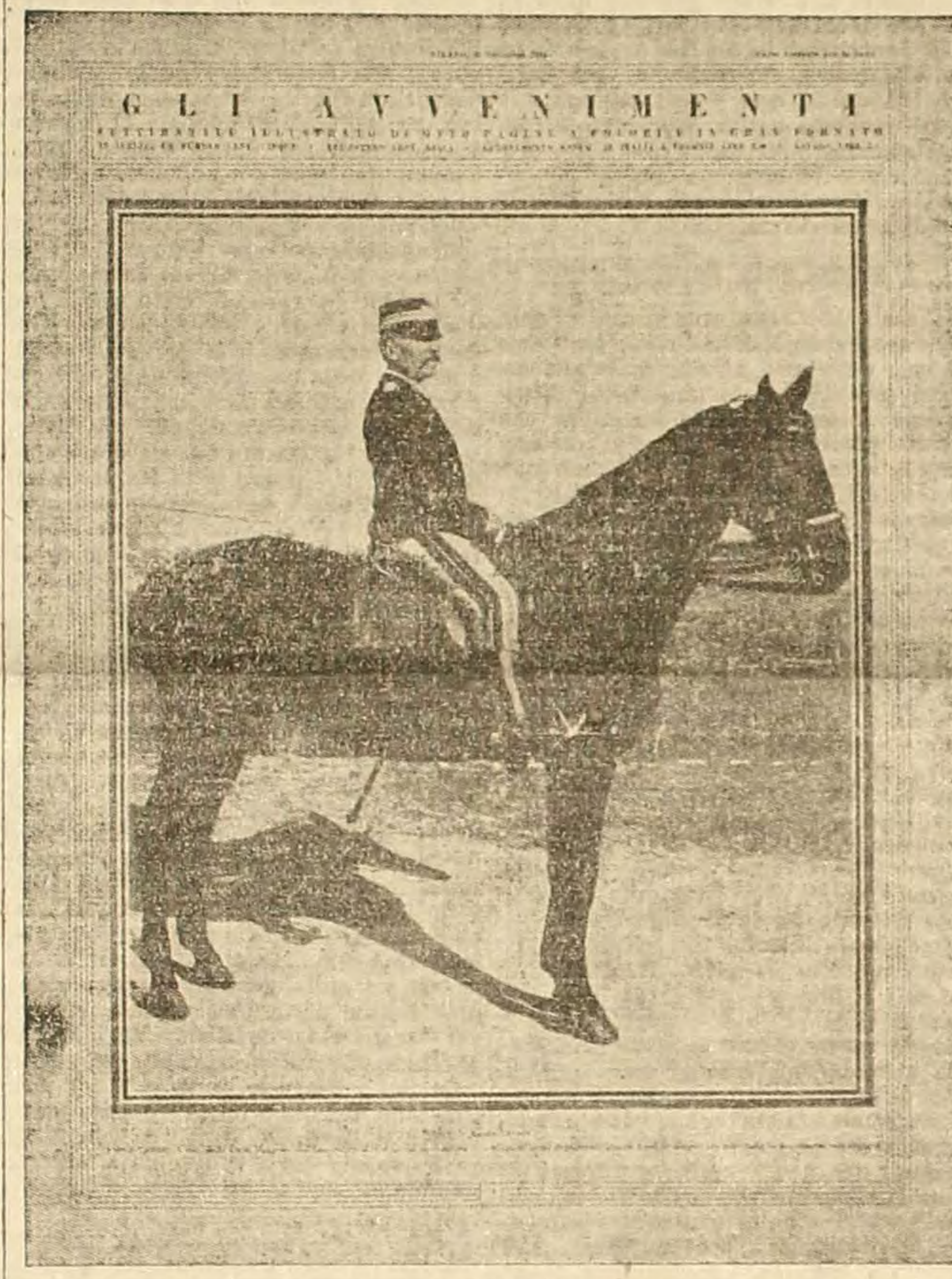
Abbonamento eccezionale RESTO CARLINO e GLI AVVENIMENTI per un anno L. 20

Il nuovo grande Settimanale illustrato offerto ai nostri abbonati. Formato originale cm. 38x50 - Otto pagine - Due colori - Primo numero 8 gennaio