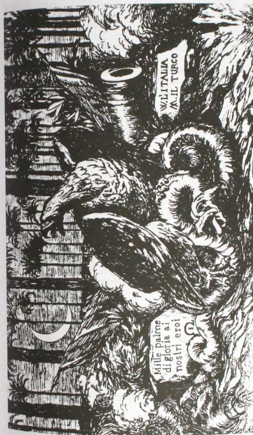
Fig. 1. Cartolina postale sulla guerra italo-turca [1912], non intestata (Biblioteca Comunale dell'Archiginnasio, fondo Zanotti Rizzoli, 12.1.2).