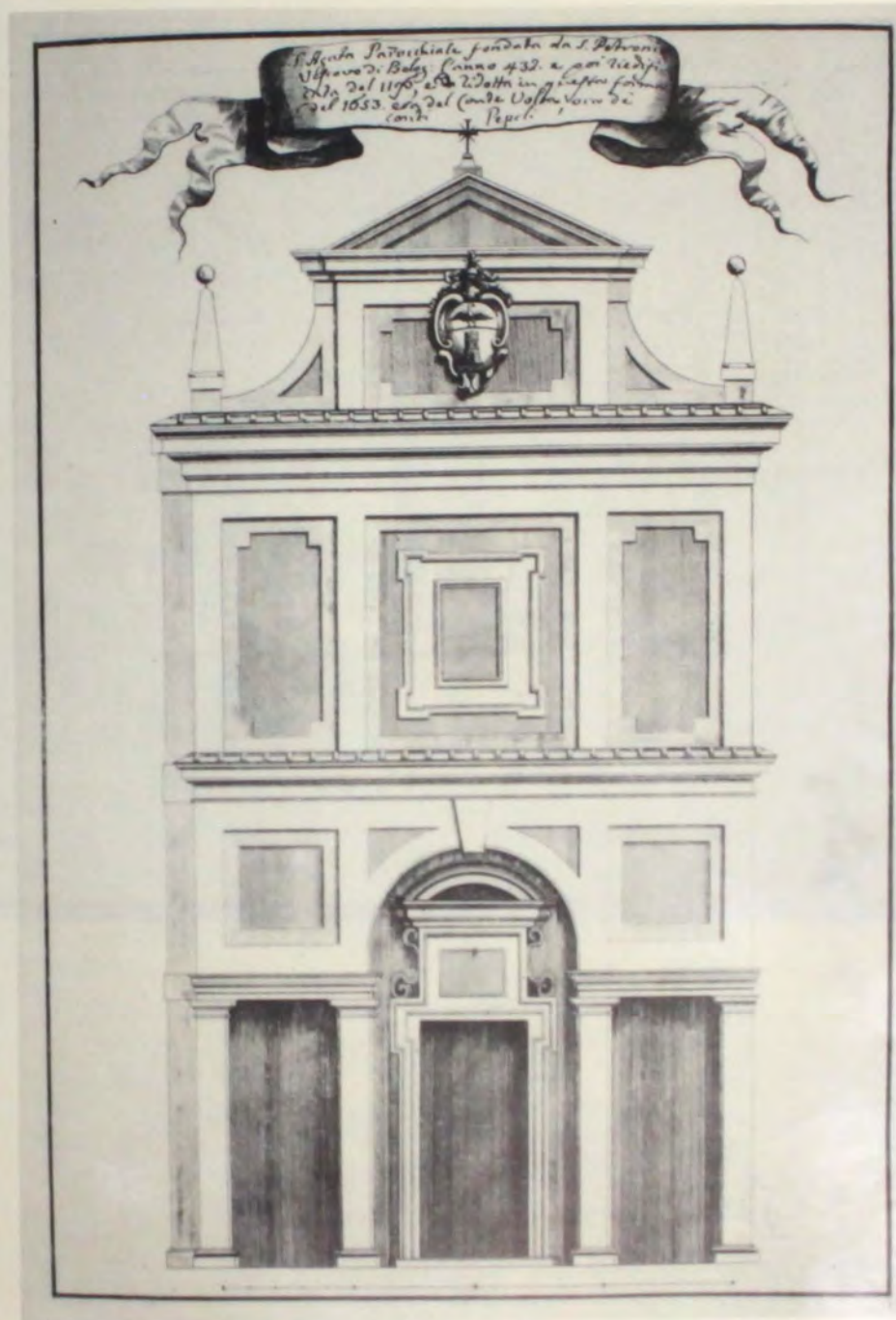
Prospetto della Chiesa di S. Agata

24 Si veda sull'argomento A. VARNI, Bologna Napoleonica , Bologna, M. Boni, 1973.