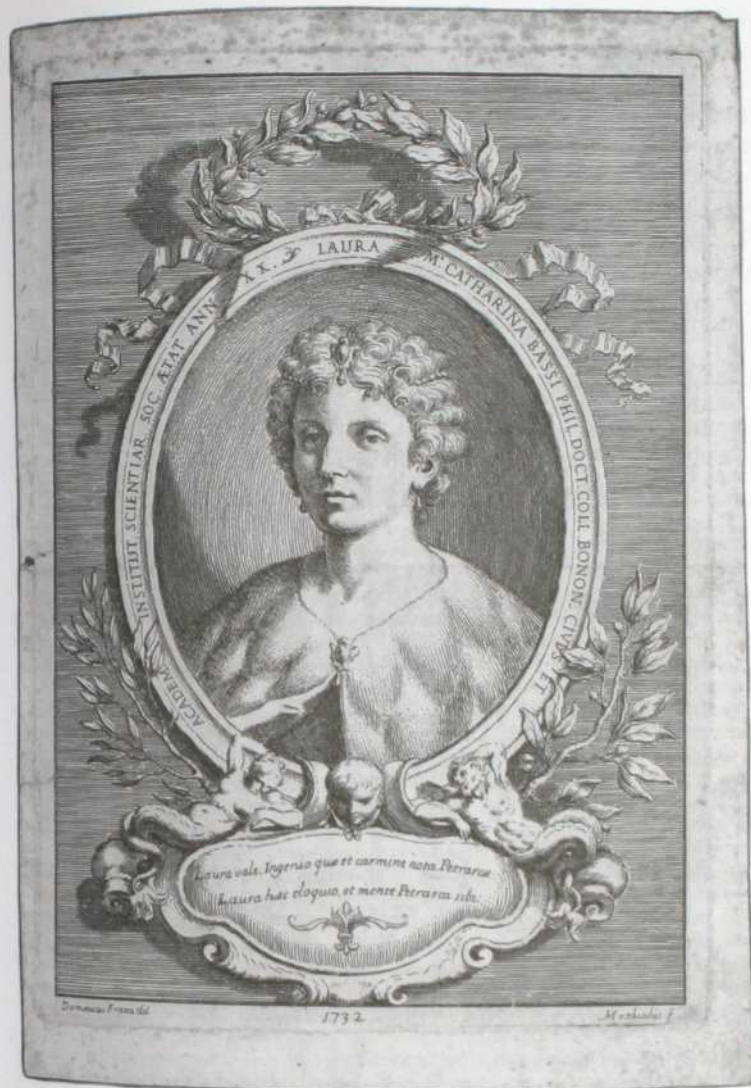
Fig. 1. Ritratto di Laura Bassi in occasione della laurea, 1732, acquaforte di Ludovico Mattioli su disegno di Domenico Maria Fratta (BCABO, GDS, Collezione dei ritratti, A/5, cart. 30, n. 3).