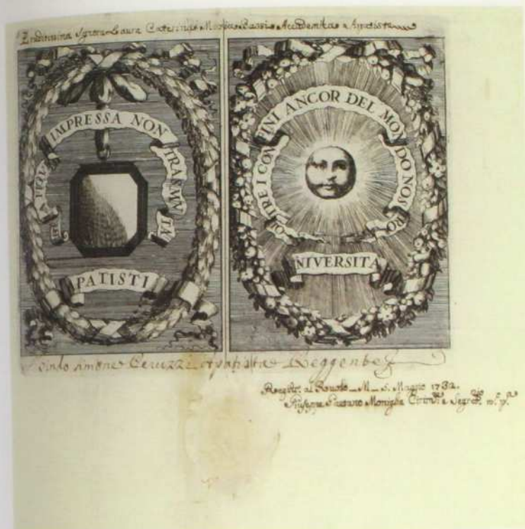
Tav. 1. Diploma accademico rilasciato nel 1732 a Laura Bassi dall'Università degli Apatisti di Firenze (BCABo, fondo speciale «Laura Bassi e famiglia Veratti», VI.3.2).