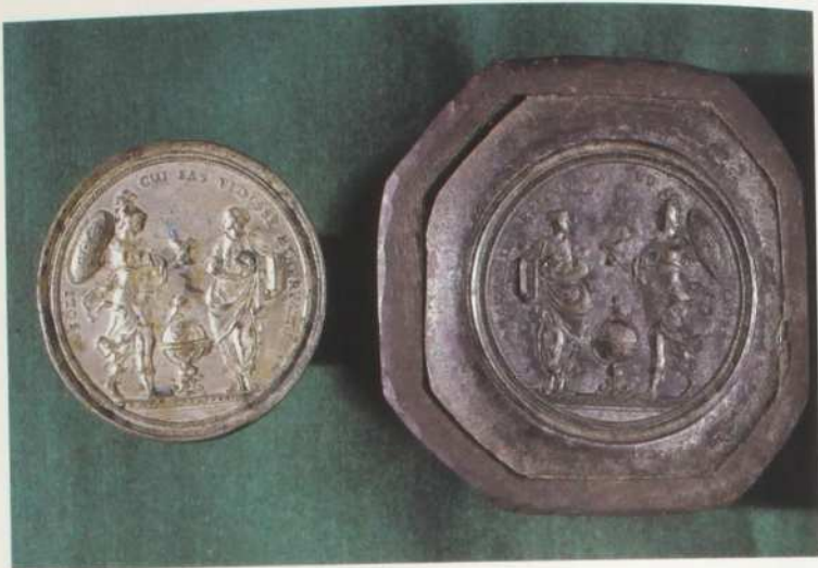
Tav. 2. Medaglia in argento coniatata nel 1732, in occasione della prima lezione tenuta da Laura Bassi all'Archiginnasio di Bologna, e punzone per il conio del recto , con Minerva che consegna ad una giovane una lucerna accesa (BCABo, fondo speciale «Laura Bassi e famiglia Veratti», VI.9,10).