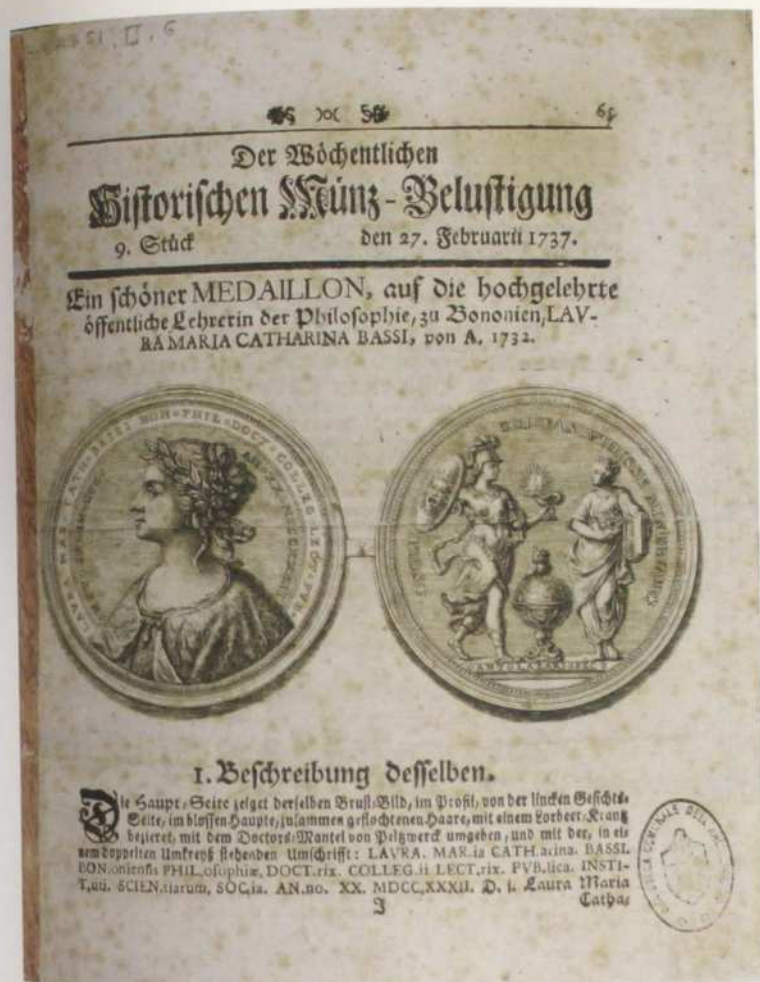
Tav. 3. JOHANN DAVID KÖHLER, Der Wöchentlichen Historischen Münz-Belustigung , Nürnberg, bey Christoph Weigels des ältern Kunsthändlers seel. Wittwe, 1729-1750, 9. Stück, 27 feb. 1737, p. 65 (BCABo, fondo speciale «Laura Bassi e famiglia Veratti», VII.6).