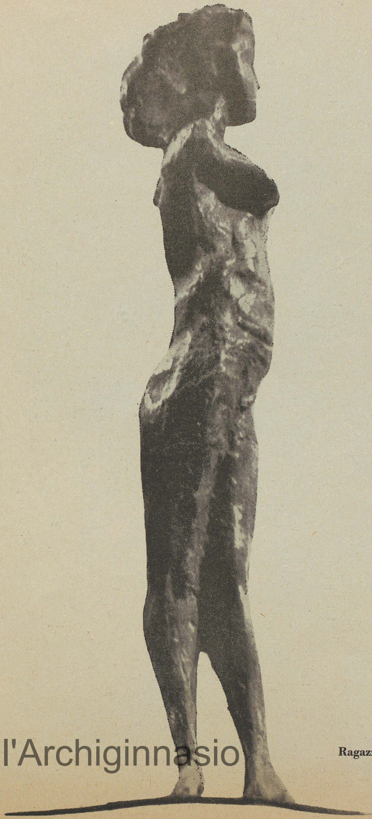
Ragazza sul filo, 1958