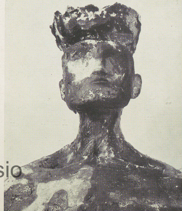
Regina, 1959, particolare