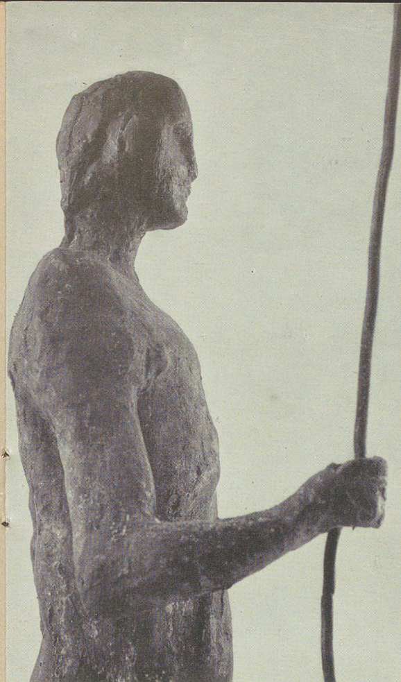
Pastore, 1958, particolare