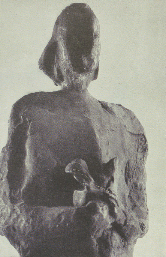
Donna con pianta, 1959, particolare