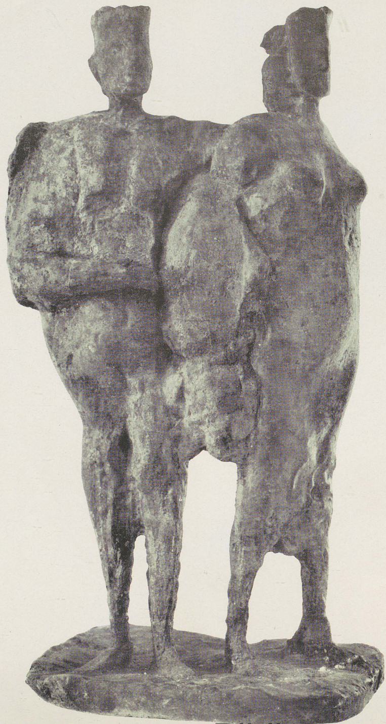
Re e regina, 1959