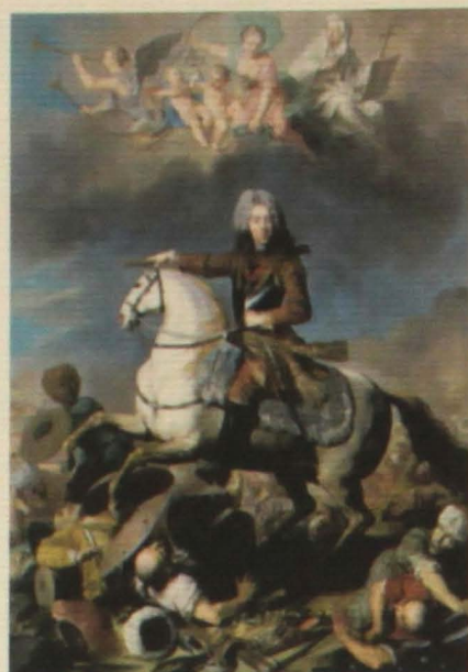
Circolo Principe Eugenio di Savoia Soissons