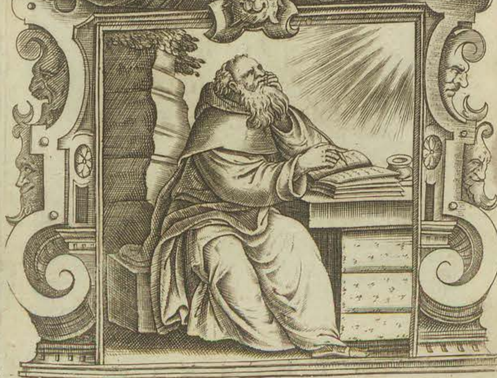
SPECIES COELI IN VISIONE GLORIÆ. Ecclesiastici Cap. 73.

Rupe ueni inculta, nec letis pascua campis Nunc pateant, animal dulcia pande ferox. Orbis successus turbantes cuncta, trucesq; Eueniant, natos bellua fœua uoret. Roma tuis lacrymis totus iam personat orbis, Hoc tamen ipsa uides læta uigere pios. Se tibi iam magno fulgens demittit Olympo En Deus omnipotens, porrigit atque manus.