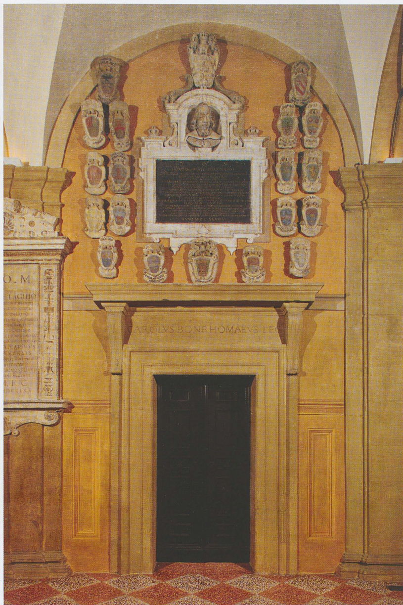
Fig. 8 - Monumento Beati dopo l'intervento di ritocco realizzato nel 2008 in una foto, num. id. 7227 ter, scattata il 5 novembre 2008.