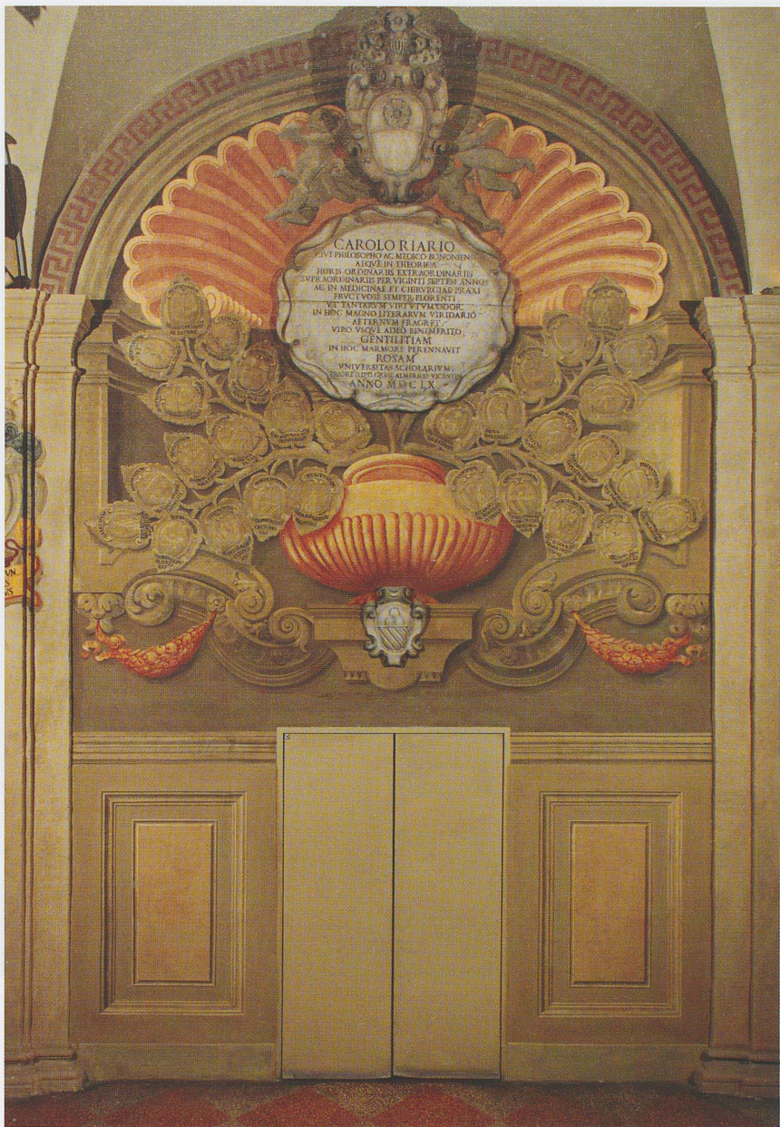
Fig. 4 – Monumento Riario dopo il restauro in una foto, num. id. 7345 bis, scattata il 5 novembre 2008.