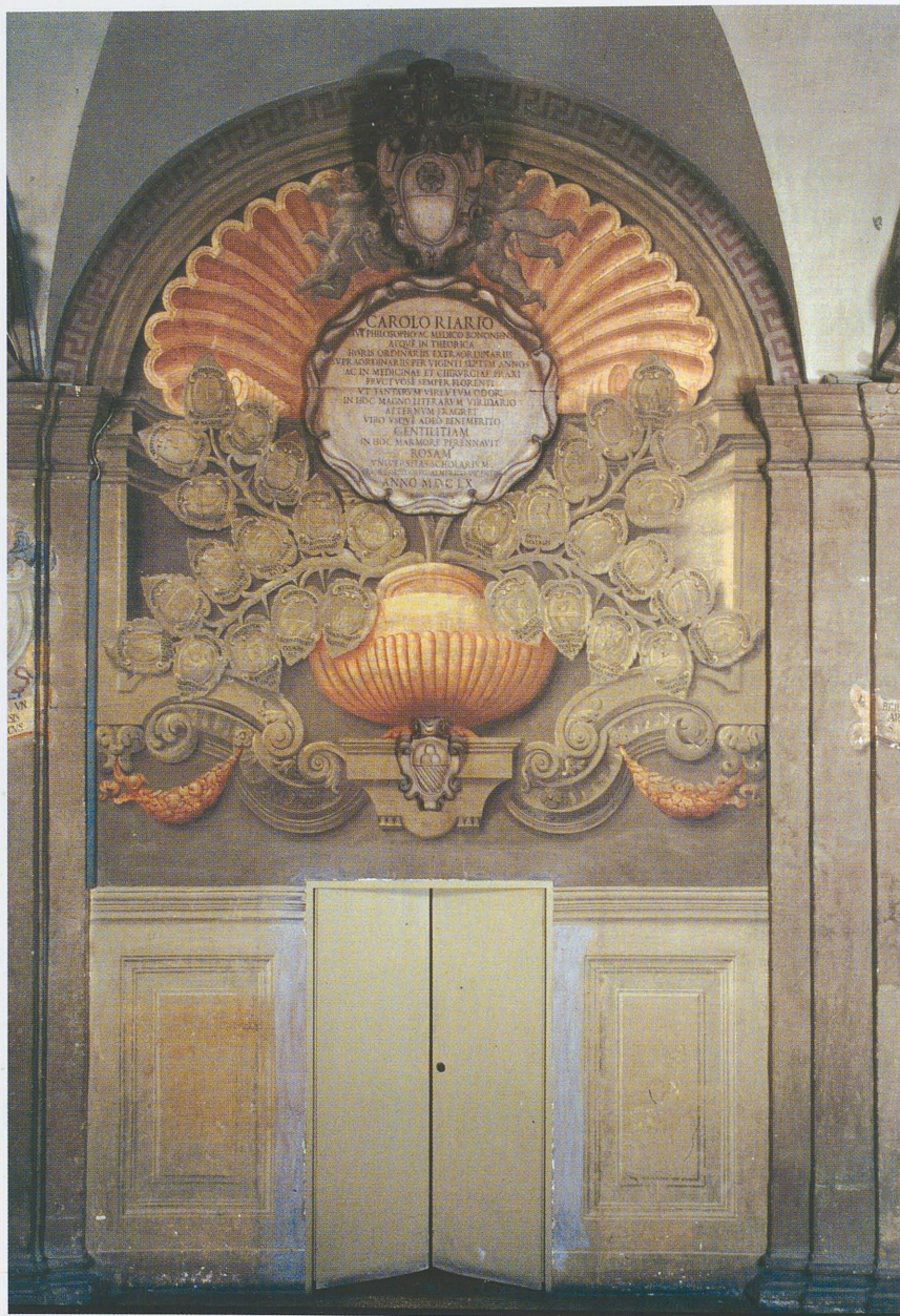
Fig. 3 - Monumento Riario prima del restauro in una foto, num. id. 7345, realizzata nel febbraio 2000.