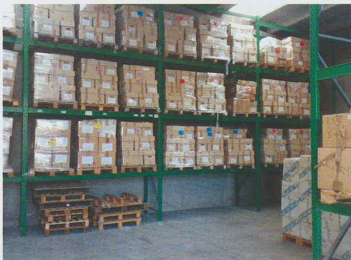
Fig. 2 – Il deposito librario ricavato nell'ex Falegnameria comunale in via dell'Industria 2 per concentrarvi gli scatoloni con i libri duplicati o, comunque, per il momento accantonati, che fino al 2008 erano conservati nelle soffitte dell'Archiginnasio (foto scattata nel dicembre 2010).