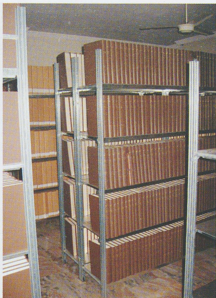
Fig. 1 – Il deposito di Granarolo, realizzato per ospitare i quotidiani e gli altri periodici meno frequentemente consultati (foto scattata nel marzo 2011).