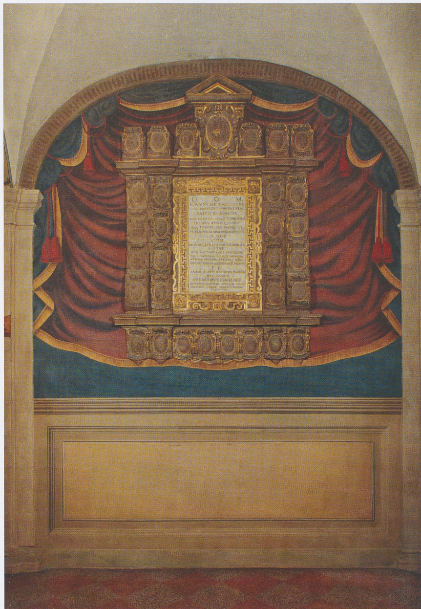
Fig. 6 – Monumento Fantuzzi dopo il restauro in una foto, num. id. 7364 bis, scattata il 5 novembre 2008.