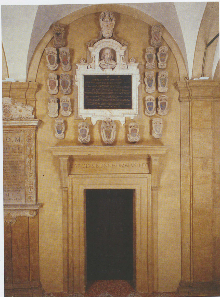
Fig. 7 - Monumento Beati prima dell'intervento di ritocco realizzato nel 2008 in una foto, num. id. 7227 bis, scattata il 4 marzo 2003.