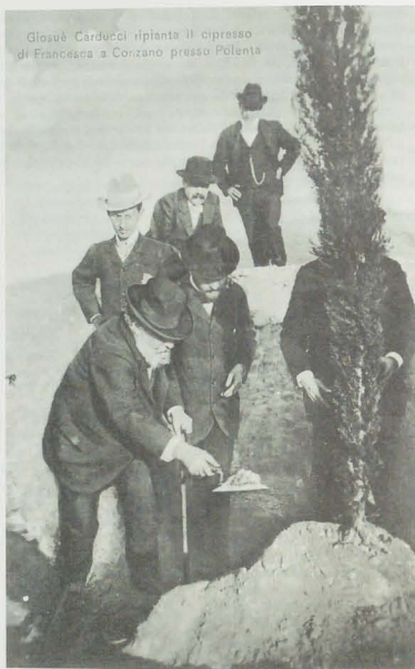
Fig. 20. Fotografia riprodotta su cartolina postale, raffigurante Carducci mentre pianta un cipresso in onore di Francesca da Rimini presso Polenta. Dono di Marco Formato, Parma (8 gennaio 2008) (BCABO, GDS, Collezione dei Ritratti, B/C, n. 180).