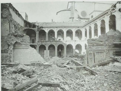
Fig. 1. Veduta del quadrilgiato inferiore dell'Archiginnasio, ripresa dalle rovine della Cappella dei Bulgari sul lato orientale, dopo il bombardamento del 29 gennaio 1944 (BCABo, Gabinetto disegni e stampe, Fotografie di Bologna, Edifici colpiti dai bombardamenti, Album I, n. 32).

mitano, con un risultato formale proprio, che non si ripete nel quadrilgiato superiore e nei corridoi dei Legisti e degli Artisti.