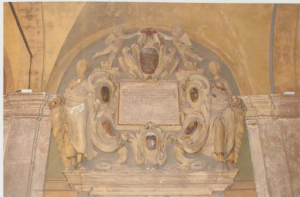
Fig. 3. Monumento celebrativo del cardinale Benedetto Giustiniani, lato orientale del quadrilloggiato inferiore, arcata XV, prima del restauro.

Se per i monumenti Beati e Sementi si ha una sufficiente documentazione fotografica dei danneggiamenti e degli interventi di restauro attuati negli anni 1946-1950, che possono definire con maggiore precisione la metodologia e le tecniche del restauro, per il monumento Giustiniani mancano le fasi della ricostruzione: pertanto uno degli obiettivi delle indagini propedeutiche al restauro si pone nell'individuazione delle porzioni recuperate e ricomposte e di quelle totalmente rifatte e della problematica