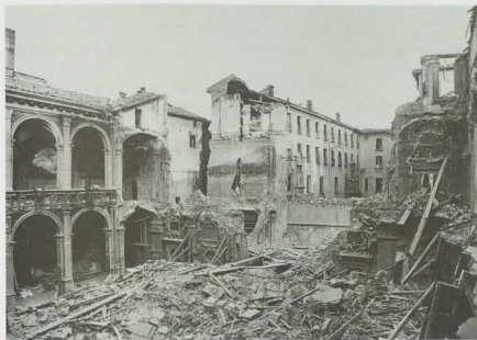
Fig. 2. Palazzo dell'Archiginnasio, veduta complessiva delle rovine dei lati orientale e meridionale del quadrilgiato inferiore.

Ad esempio le epigrafi con effigie a rilievo poste sul lato settentrionale e riferite a Bartolomeo Ambrosini, Alessandro Guicciardini, Carlo Fracassati e Francesco Saccenti collocate tra il 1663 e il 1686 rispondono agli stessi canoni compositivi, sia negli ornati che nel trattamento delle superfici e dei materiali; a questo proposito vale la pena sottolineare come la maggior parte della decorazione parietale sia stata apposta durante tutto l'arco del XVII secolo, in quel momento culturale che in particolare dalla metà del Seicento agli inizi del Settecento colloca Bologna come capitale europea della decorazione e della pittura barocca, da Canuti e