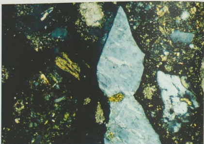
Fig. 92. Questa micrografia (ARC 1) evidenzia la presenza di diverse fasi cristalline dell'aggregato: due cristalli calcitici (al centro ed in alto), un grosso cristallo allungato di feldspato (riconoscibile per la sua caratteristica geminazione a graticcio) ed a fianco un aggregato di quarzo policristallino. Nella matrice legante sono invece riconoscibili microcristalli carbonatici ed alitici (gli ultimi tipici delle malte cementizie), che risultano particolarmente concentrati intorno ai cristalli di feldspato e di quarzo (N#, 150X).