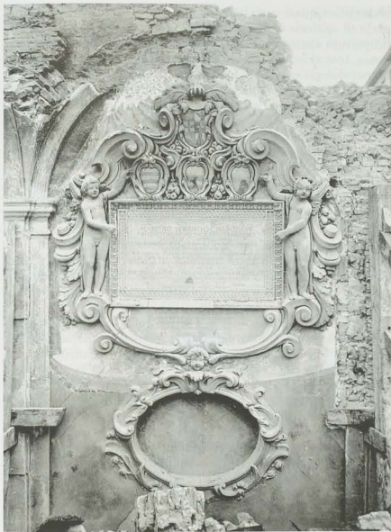
Fig. 5. Monumento dedicato a Gian Pietro Sementi, lato orientale del quadriloggiate inferiore, arcata XII (BCABo, GDS, Fotografie di Bologna, Edifici colpiti dai bombardamenti, Album I, n. 6).