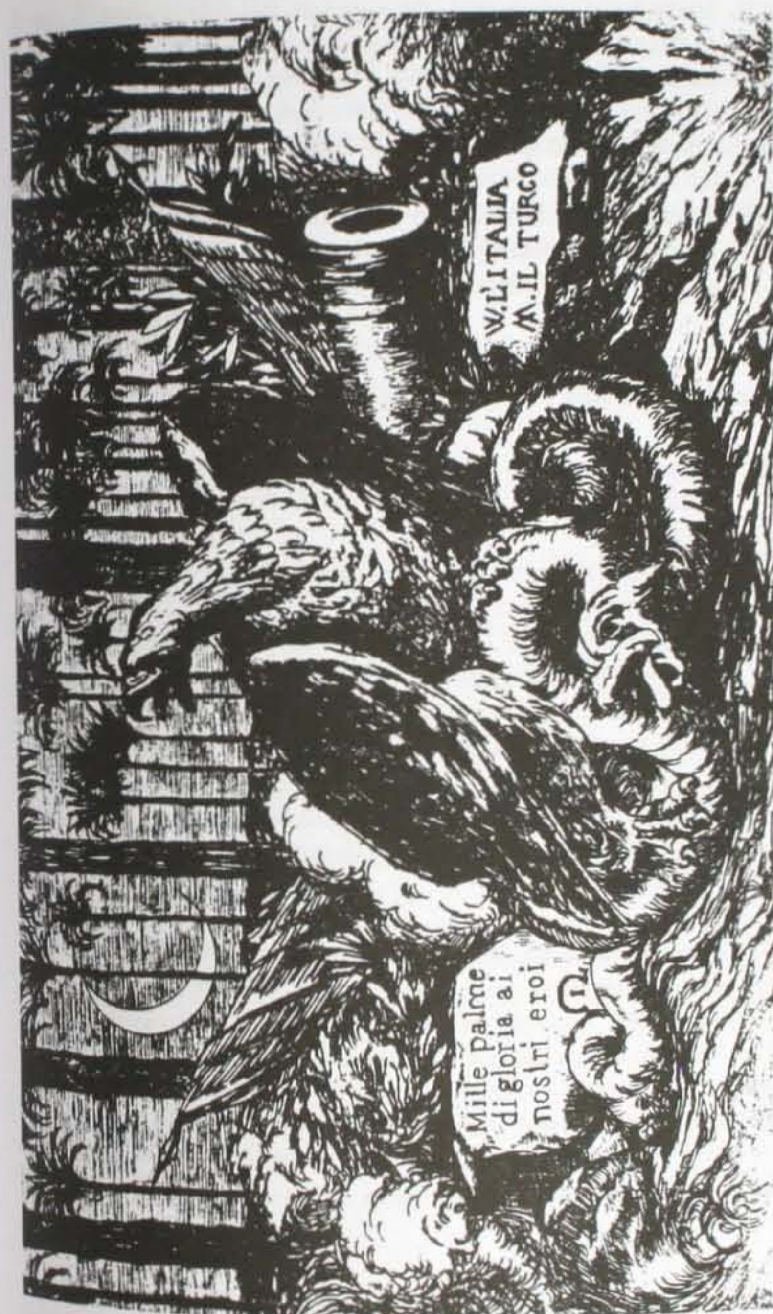
Fig. 1. Cartolina postale sulla guerra italo-turca [1912], non intestata (Biblioteca Comunale dell'Archiginnasio, fondo Zanotti Rizzoli, 12.1.2).