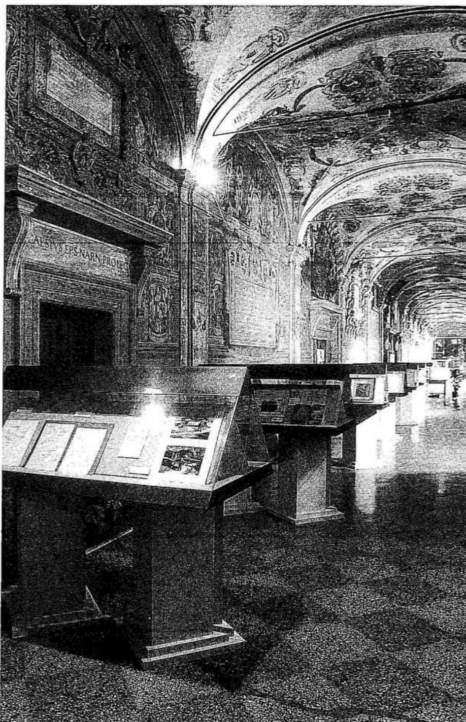
2. Archiginnasio: altra veduta prospettica dell'esposizione, ripresa dall'ingresso della sala dello Stabat Mater.