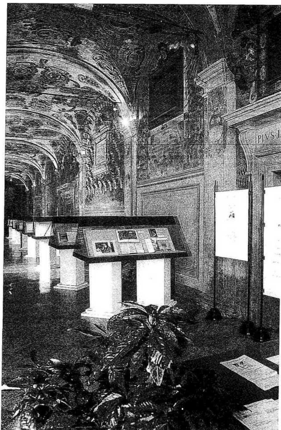
1. Archiginnasio, corridoio d'accesso alla sala dello Stabat Mater: veduta d'insieme dell'esposizione Un itinerario nel mondo della parola , allestita in occasione del convegno «Riccardo Bacchelli e il mondo padano».