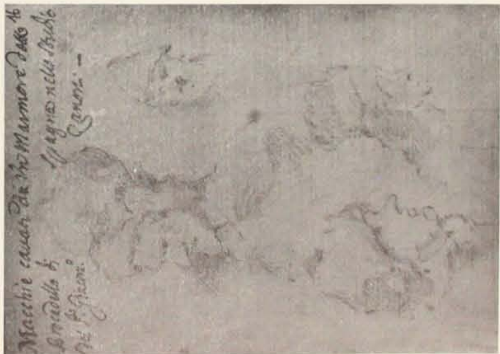
Fig. 1 - Giuseppe Maria Mitelli: Quattro volti virili grotteschi.