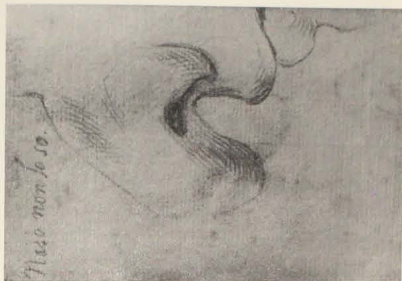
Fig. 2 - Giuseppe Maria Mitelli: Naso non lo so.