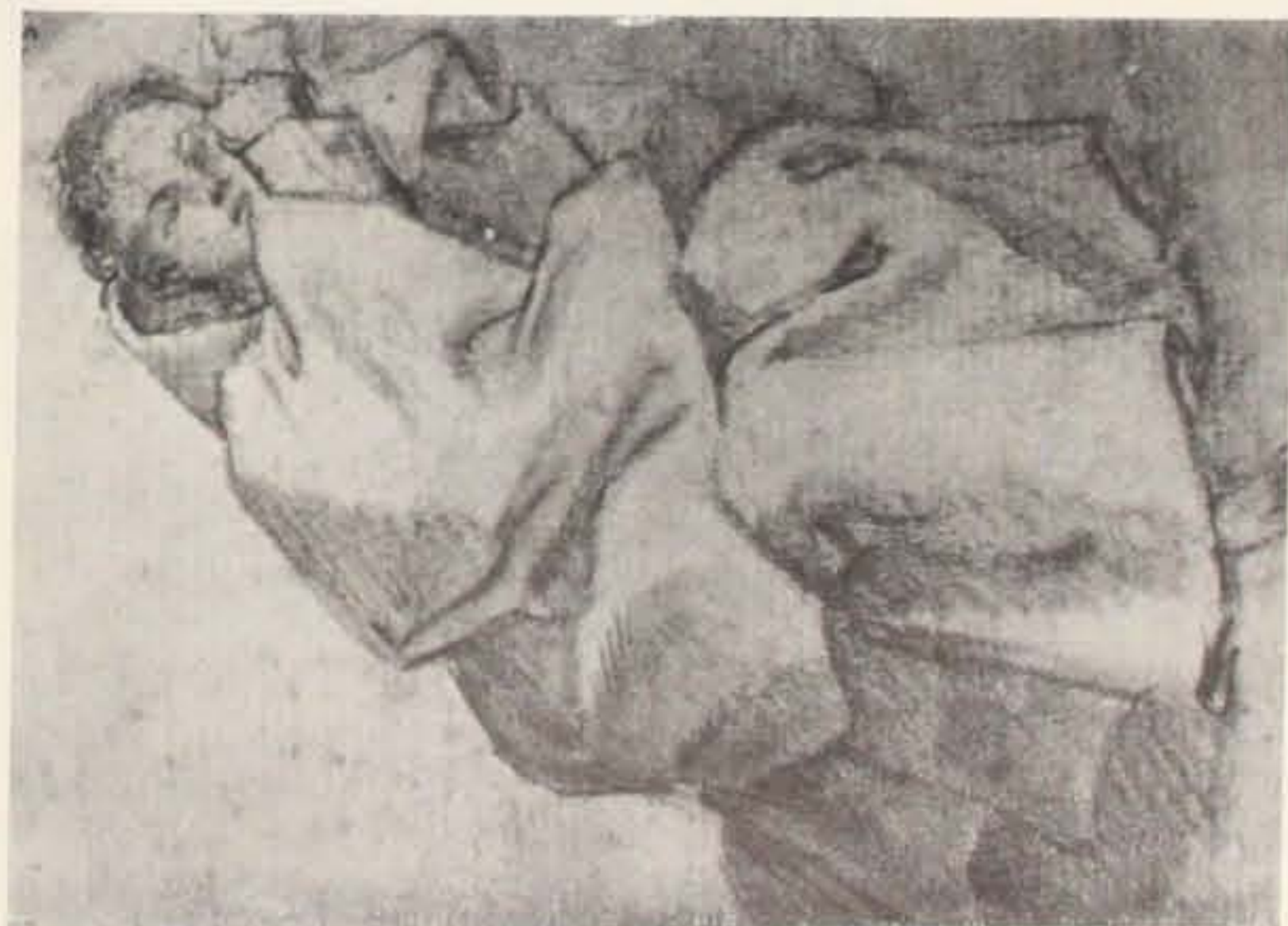
Fig. 7 - Giuseppe Maria Mitelli: Fugge seduto.