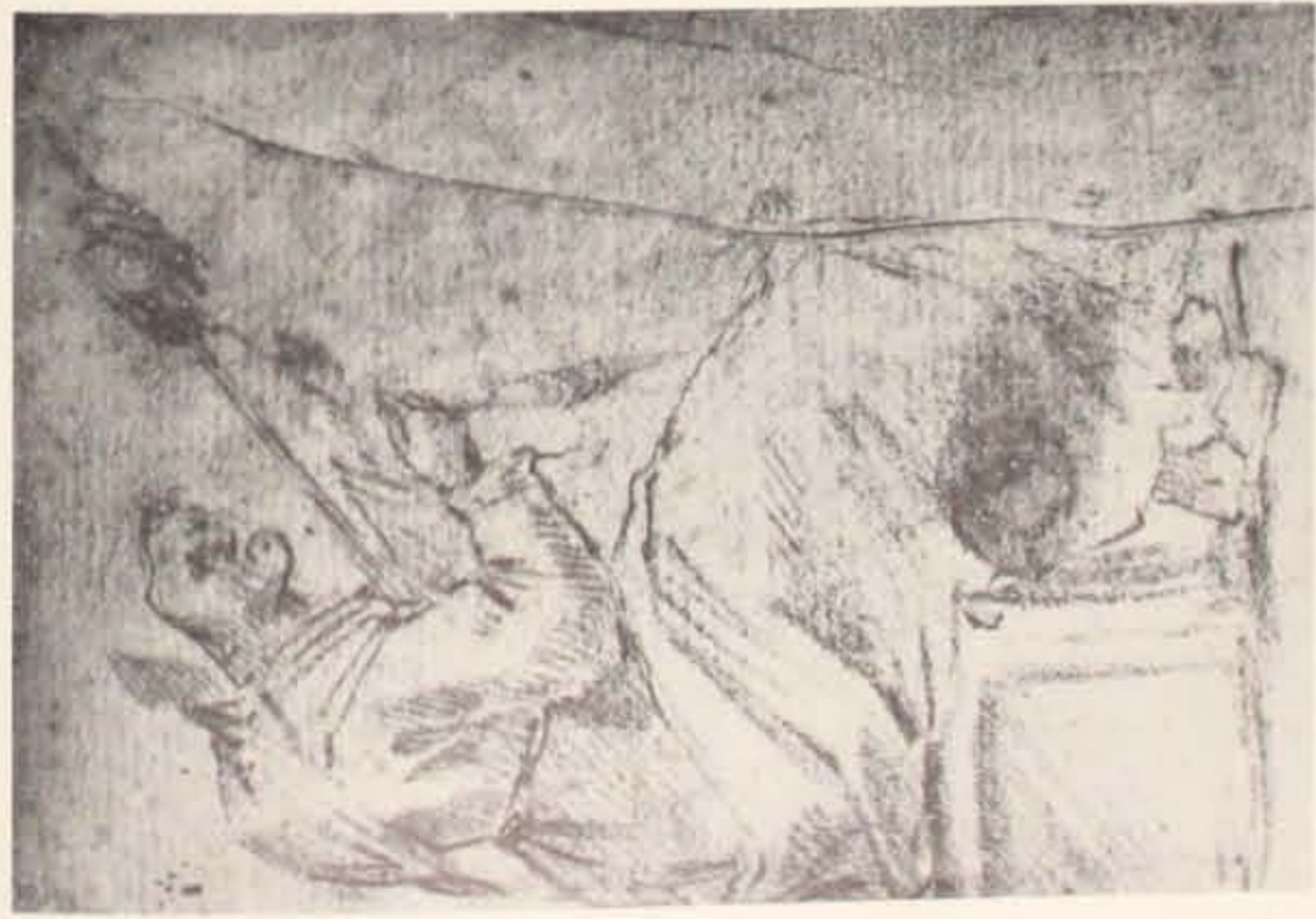
Fig. 9 - Giuseppe Maria Mitelli: Vecchia che fila.