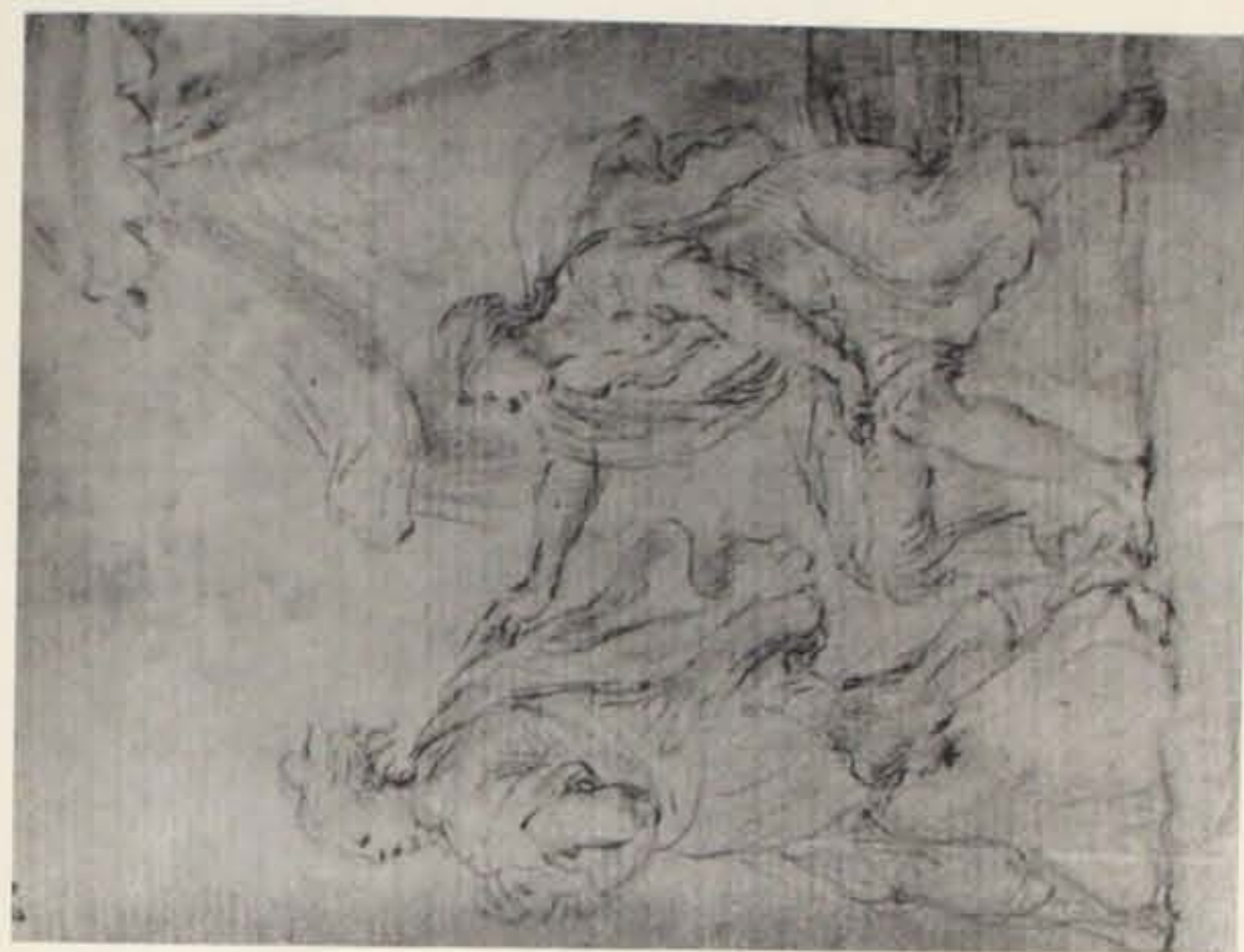
Fig. 8 - Giuseppe Maria Mitelli: Giuseppe fugge dalla moglie Putifarre (da Properzia de Rossi).