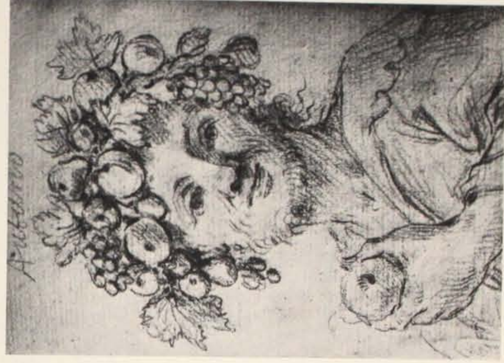
Fig. 6 - Giuseppe Maria Mitelli: L'Autunno.