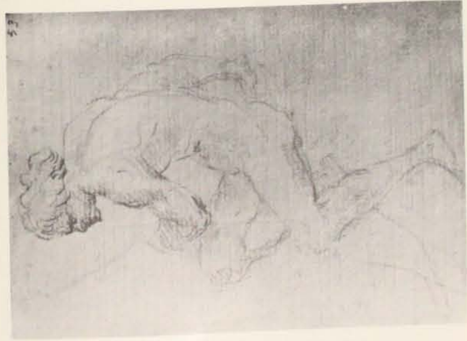
Fig. 3 - Giuseppe Maria Mitelli: Nudo Virile .