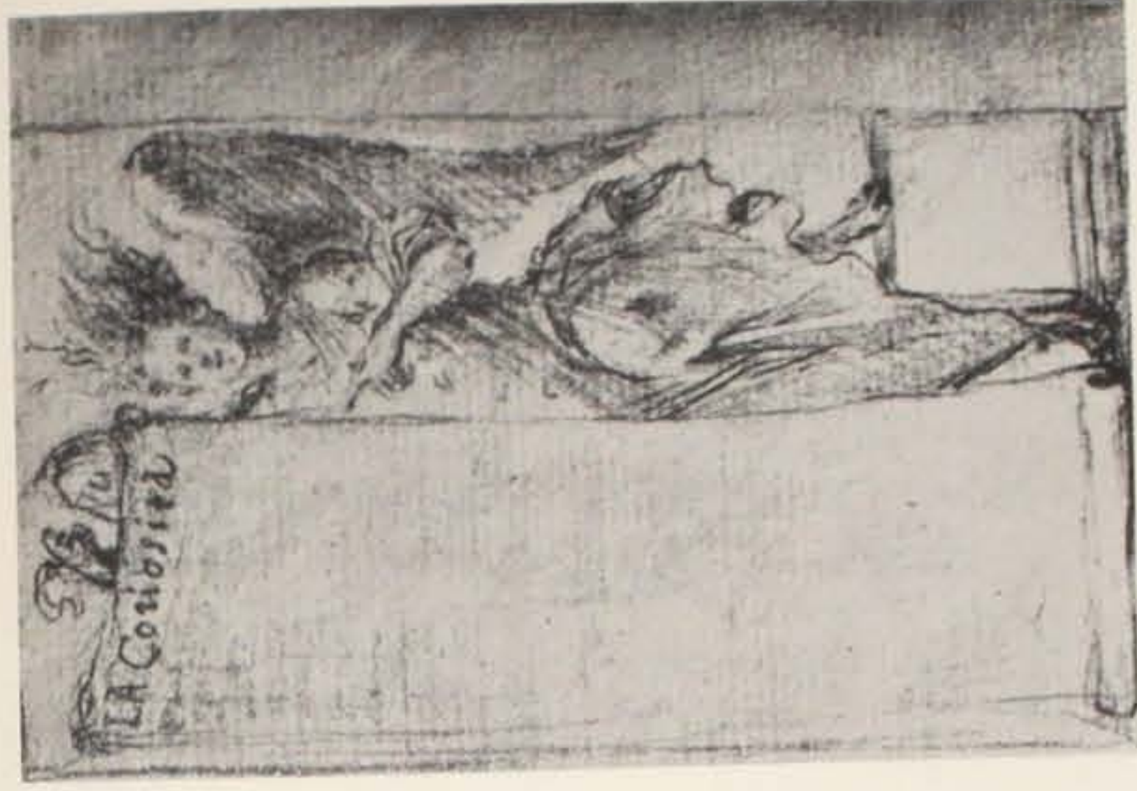
Fig. 4 - Giuseppe Maria Mitelli: La Congiura .