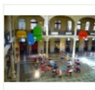
02_bsb veduta dal primo piano su piazza coper...