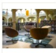
03_bsb primo piano .JPG