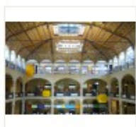
01_Salaborsa VEDUTA generale.jpg

http://www.archiginnasio.it/html/area_stamp.htm