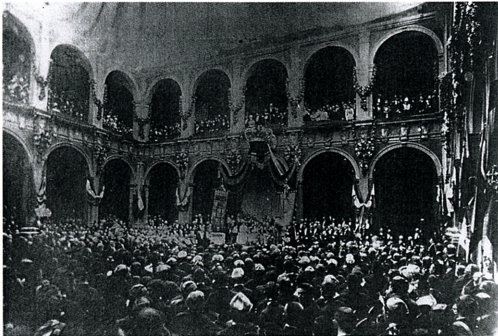
Il cortile dell'Archiginnasio parato a festa durante la cerimonia per la celebrazione dell'VIII centenario della fondazione dell'Università di Bologna, 12 giugno 1888. Nuova xilografia