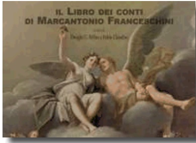
Il Libro dei conti di Marcantonio Franceschini a cura di Dwight C. Miller e Fabio Chiodini (L'Artiere Edizionalia, 2014, 486 p., 94 tav. a colori)

Il volume propone il Libro dei conti del pittore bolognese Marcantonio Franceschini (1648-1729) , prezioso taccuino autografo conservato alla Biblioteca dell'Archiginnasio di Bologna (ms. B.4067), qui edito in versione sia anastatica sia trascritta, con puntuali commenti critici. Il libro è arricchito inoltre da un vasto corpus di documenti sul pittore (lettere, biografie manoscritte, l'inventario della collezione dell'artista) e da ben 94 tavole tra affreschi, dipinti, disegni, cartoni preparatori, tutte corredate da relative schede scientifiche.