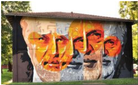
il murale dedicato a Roberto Roversi realizzato da Orticanoodles

Martedì 10 giugno 2014, ore 19 presso Biblioteca Luigi Spina via Tommaso Casini 5